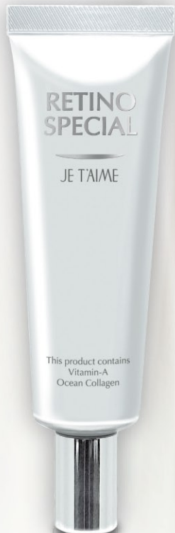
レチノスペシャル 25g 10,000円(税込)