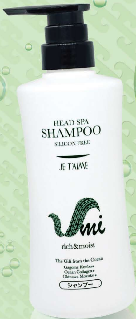
ヘッドスパシャンプー 480ml 3,800円(税込)