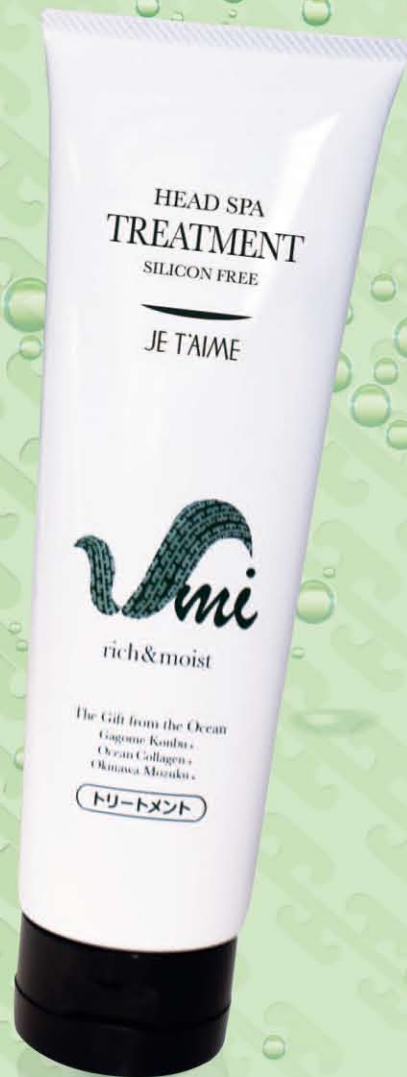
ヘッドスパトリートメント 280g 3,800円(税込)