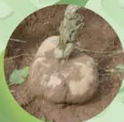
フエリアミリフィカ