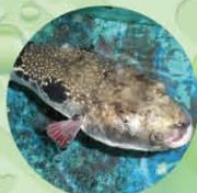
とらぶく コラーゲン