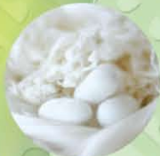
シルクプロテイン